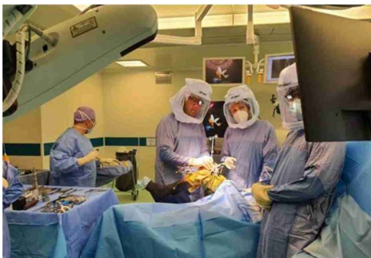
Un'operazione nel reparto di Ortopedia di Ravenna con attrezzatura robotica all'avanguardia, a destra il segretario regionale Fp Cgil Marco Bonaccini