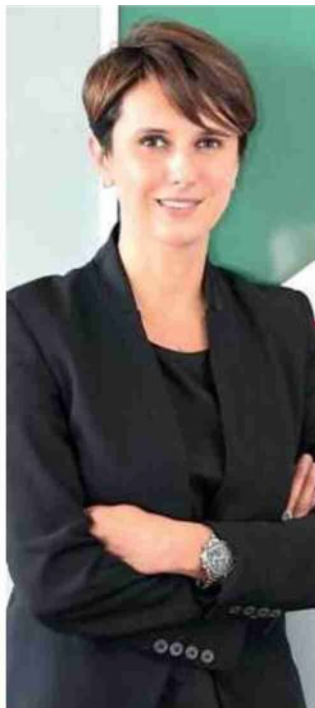
Raffaele Donini assessore regionale alla Salute